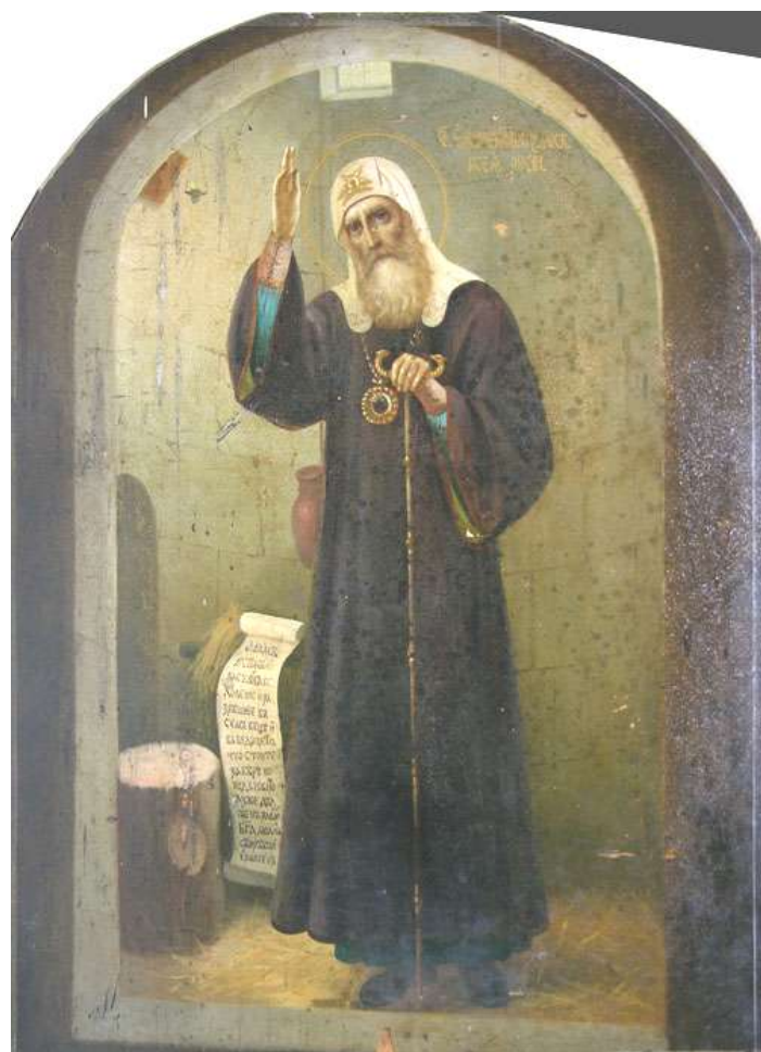
Патриарх Ермоген в темнице

В заточении патриарх молился Богоматери, из темницы до русских патриотов доходили его призывы, чтобы они "крепко стояли за веру, унимали грабеж, сохраняли братство и, как обещались, положили души свои за Дом Пречистой, за чудотворцев и за веру". И вскоре сформировалось нижегородское ополчение Минина и Пожарского.