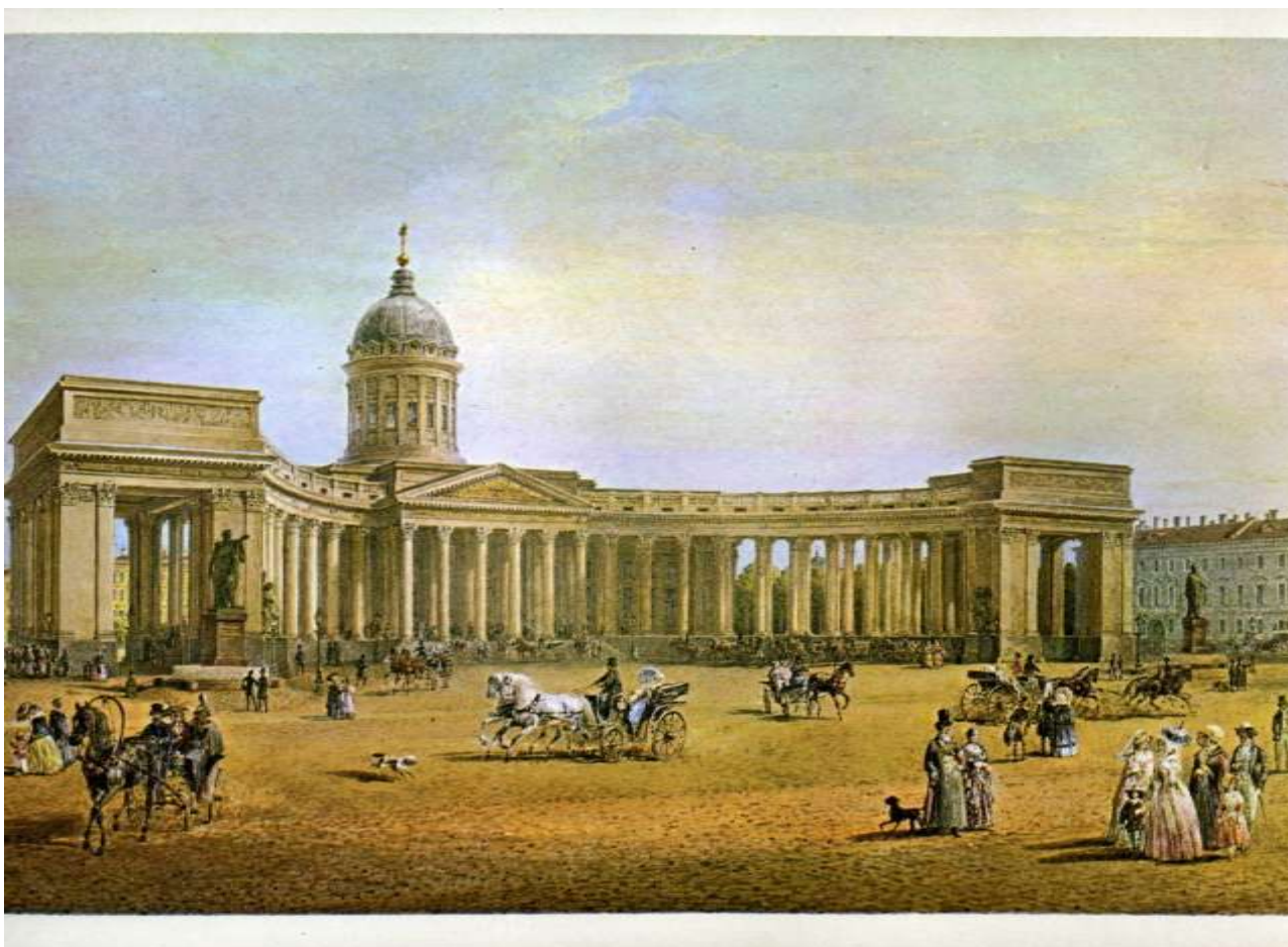
Казанский кафедральный собор в Санкт-Петербурге

Собор строился десять лет, а в центральный иконостас была помещена Казанская икона Божией Матери - святыня Санкт-Петербурга.