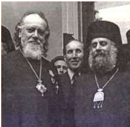
Митрополит Гор Ливанских Илия Карам и Патриарх Алексий I (фото 1947 г.)

Перед приходом гостя Сталин вызвал владыку Алексея, ставшего уже Патриархом, и спросил: "Чем может отблагодарить митрополита Илию Русская Церковь?" Патриарх предложил подарить митрополиту Ливанскому икону Казанской Божией Матери, крест с драгоценностями и панагию, украшенную драгоценными камнями из всех областей страны, чтобы вся Россия участвовала в этом подарке. По распоряжению Сталина самые искусные ювелиры изготовили панагию и крест.