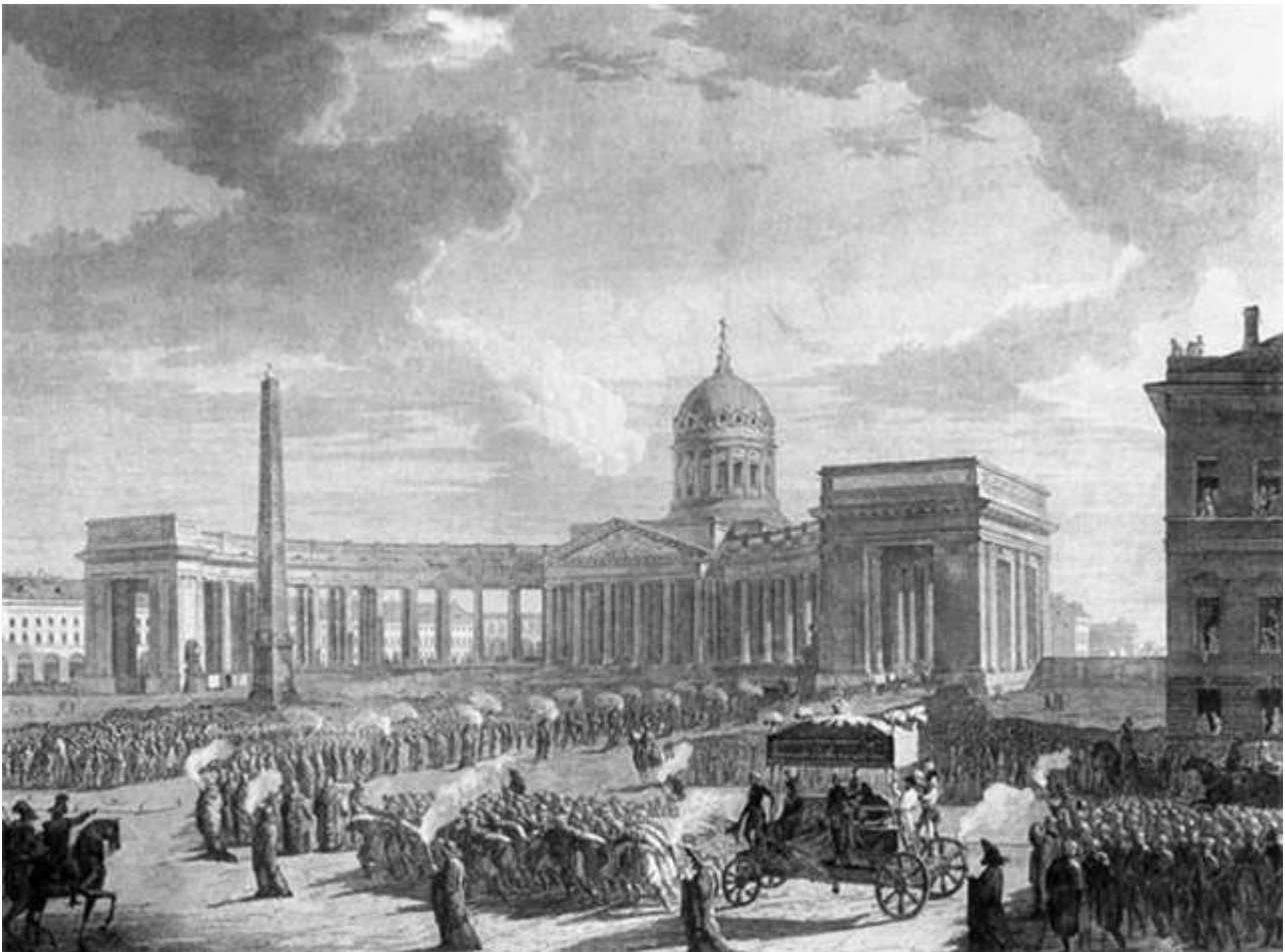
Казанский кафедральный собор в Санкт-Петербурге. Похороны М.В.Кутузова

После 1917 года Казанская икона страдает и бедствует вместе с народом. 36 лиц духовного звания, в том числе митрополит Вениамин, были арестованы и приговорены к мученической смерти "за сопротивление в изъятии церковных ценностей для голодающих Поволжья". Иконостас - бесценный художественный памятник, оклад и прочее убранство иконы были спешно разобраны и отправлены на переплавку. Вершиной надругательства стало "упразднение" собора в 1929 году и создание в нем Музея религии и атеизма. Чудом спасенную Казанскую икону сумели перенести в действующий Князь-Владимирский собор.