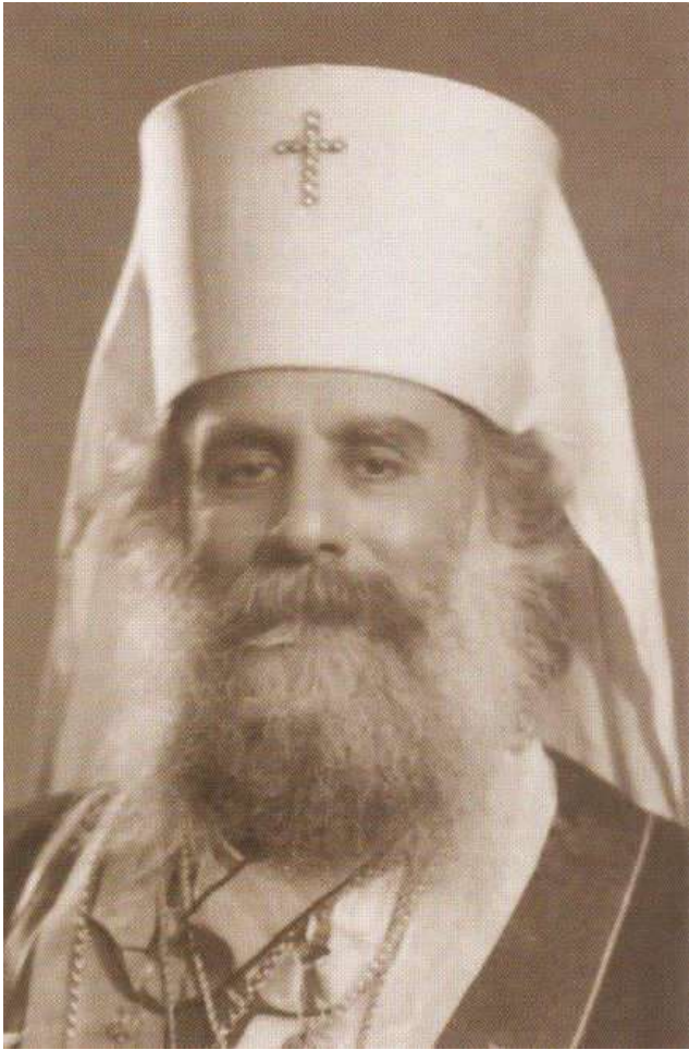
Митрополит Гор Ливанских Илия Карам

В подземелье не доносился ни один звук с земли. Затворник не ел, не пил, не спал - только стоял на коленях перед иконой Божией Матери с лампадой и молился. Каждое утро ему приносили сводки с фронтов. Через трое суток молитвы ему явилась в огненном столпе Сама Матерь Божия и объявила, что он должен передать определение Божие для страны Российской. Если все, что определено, не будет выполнено, то Россия погибнет.