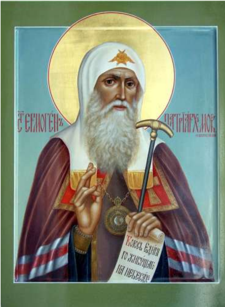
Св. Ермоген Патриарх Московский и всероссийский

В конце июня 1579 года в Казани случился пожар, уничтоживший большую часть города. Пожар начался с дома Онучиных.