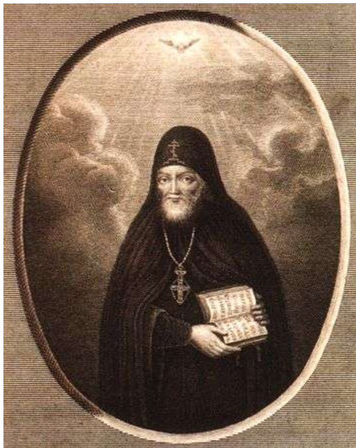
Святитель Митрофан Воронежский

Есть крепко утвердившееся в народе предание о том, что Казанской иконой благословил Петра Великого святитель Митрофан Воронежский еще до основания Петербурга: "Возьми икону Казанскую Божией Матери - и она поможет тебе победить злого врага. Потом перенесешь эту икону в новую столицу... Казанская икона станет покровом города и всего народа твоего".