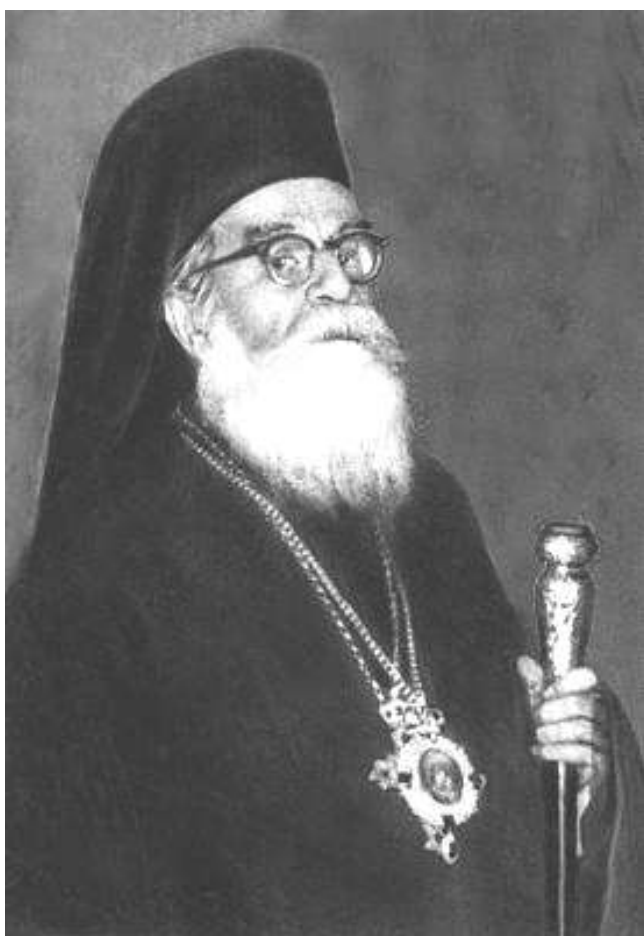
Александр III, Патриарх Антиохийский

Когда началась Великая Отечественная война, Патриарх Антиохийский Александр III обратился к христианам всего мира с посланием о молитвенной и материальной помощи России.