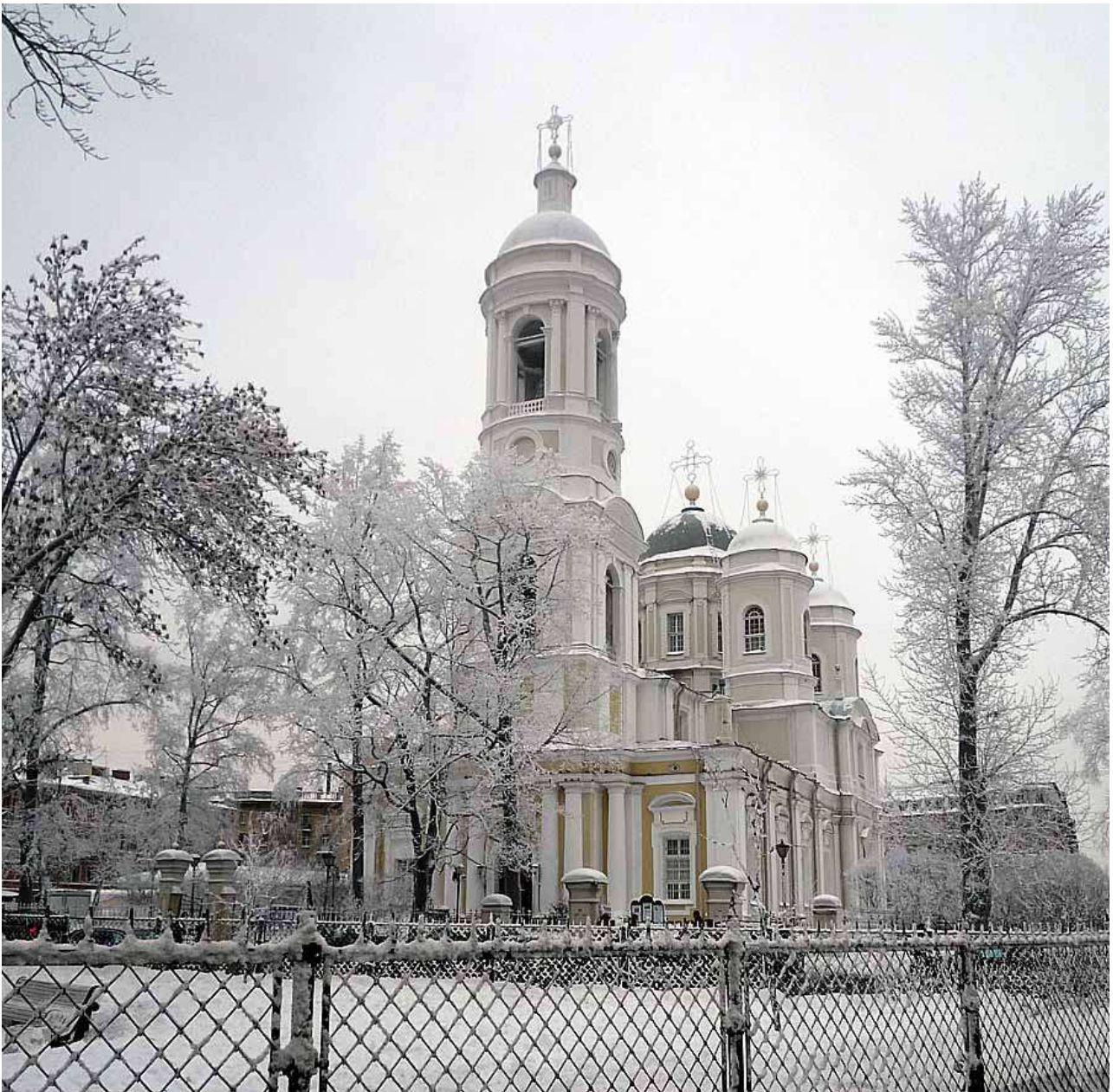
Князь-Владимирский собор в Санкт-Петербурге

Затем Казанскую икону перевезли в Сталинград. Там перед ней шла непрерывная служба - молебны и поминовения погибших воинов. Икона стояла среди наших войск на правом берегу Волги, и немцы не смогли перейти реку, сколько усилий ни прилагали. Был момент, когда защитники города остались на маленьком пятачке у Волги, но немцы не смогли столкнуть наших воинов, ибо там была Казанская икона Божией Матери.