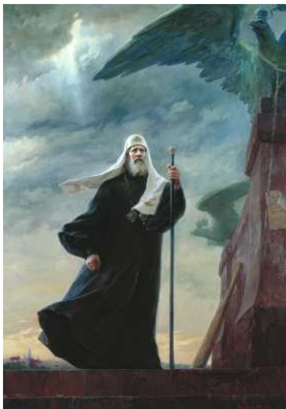
Патриарх Тихон.

В годы Гражданской войны духовенство воспринималось большевиками как враждебная сила. Карательные отряды в составе Красной армии расстреливали, закапывали в землю заживо, пытали представителей духовенства, которых подозревали в сочувствии к белогвардейцам. Казни сопровождалось глумлением и издевательством над православной верой. Так, одного священника в городе Свияжске красноармейцы, раздев, бросили в прорубь со словами: "Ты крестил, и мы тебя будем крестить". Общее число жертв среди духовенства с октября 1917 по конец 1921 года достигло 10 тысяч человек.