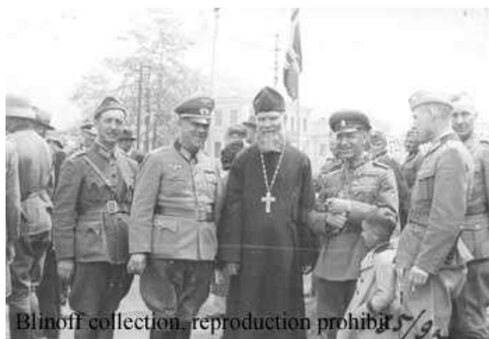
Архиепископ Берлинский Серафим (Лядэ), фото 1941 г.

Впрочем, осенью 1942 года попытки Германии разыграть антимосковскую "церковную карту" активизировались. Разрабатывались планы проведения Поместного Собора в Ростове-на-Дону или Ставрополе с избранием Патриархом архиепископа Берлинского Серафима (Лядэ) - этнического немца, принадлежащего к юрисдикции Русской Православной Церкви за рубежом.