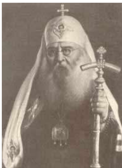
Патриарший Местоблюститель митрополит Московский и Коломенский Сергей (Страгородский) в годы Великой Отечественной войны

В первый день войны власти растерялись, газеты молчали. Митрополит Сергей первым объявил в своей воскресной проповеди о том, что началась война. Нападение 22 июня 1941 года выпало не только на воскресенье, но и на праздник Всех Святых в земле Российской просиявших, включая новомучеников, и для верующих в этом был некий мистический смысл.