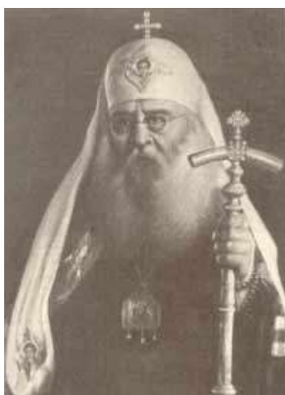
Патриарший Местоблюститель митрополит Московский и Коломенский Сергей (Страгородский) в годы Великой Отечественной войны

В первый день войны власти растерялись, газеты молчали. Митрополит Сергей первым объявил в своей воскресной проповеди о том, что началась война. Нападение 22 июня 1941 года выпало не только на воскресенье, но и на праздник Всех Святых в земле Российской просиявших, включая новомучеников, и для верующих в этом был некий мистический смысл.