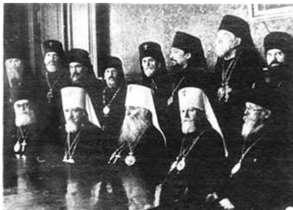
Митрополиты Сергий (Страгородский), Алексий (Симанский), Николай (Ярушевич) в окружении архиереев, возвращенных из ссылки для участия в Соборе 1943 г.

4 сентября этого же года председатель Совнаркома И. В. Сталин принял в Кремле митрополитов Сергия (Страгородского), Алексия (Симанского) и Николая (Ярушевича). Встреча Сталина с иерархами Православной Церкви явилась отправной точкой нового этапа в истории отношений между советским государством и Церквью, в истории русского и мирового Православия.