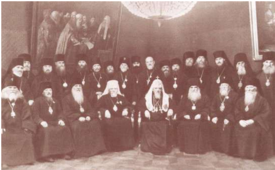
Святейший Патриарх Алексий I с архиереями, участниками Поместного Собора, февраль 1945 года

На Поместном соборе 1945 года уже "многие члены заграничных делегаций, - как информировал Г. Карпов, - высказывали предположение о том, что центр Вселенского православия необходимо перенести в Москву, поскольку Русская Православная Церковь является самой многочисленной и богатой в материальном отношении".