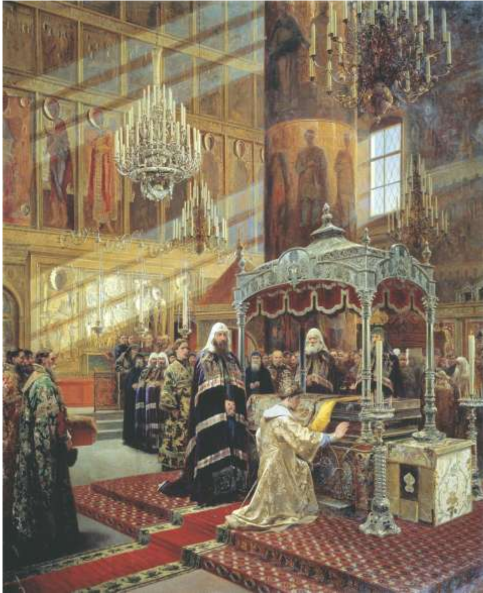
Патриарх Никон и Царь Алексей Михайлович перед гробницей святителя Филиппа

Уничтожение симфонии властей в России началось при Петре I. Им была упразднена самостоятельная церковная власть, а церковное имущество отнято в пользу государства. Петр прямо заявил о своей власти и обязанности исправлять "нестроения чина духовного", как и "чина воинского и гражданского". Церковь сводилась только "к духовному чину", подвластному монарху.