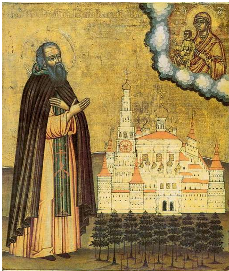
Преподобный Иосиф Волоцкий

Слово "симфония" означает "созвучие". В данном случае имеется в виду что обе силы, Церковь и государство, каждая в соответствии со своей природой служат одной цели. Церковь опекает души людей, борется с внутренним злом в них; государство же заботится о жизни земной, ограждая ее от действия внешних сил зла и обеспечивая Церкви наиболее благоприятные условия для подготовки людей к спасению.