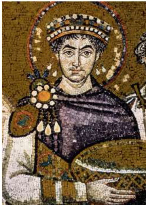
Юстиниан I Великий (мозаика)

В ходе истории складывались различные модели взаимоотношений между Православной Церковью и государством. С момента крещения Руси вектор развития взаимоотношений светской и духовной власти определялся как "симфония".