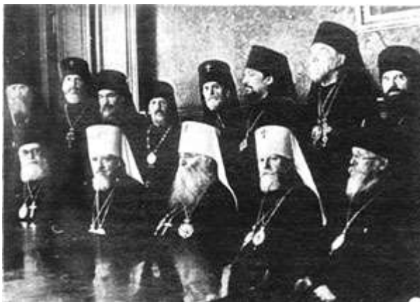
Митрополиты Сергей (Страгородский), Алексий (Симанский), Николай (Ярушевич) в окружении архиереев, возвращенных из ссылки для участия в Соборе 1943 г.

4 сентября этого же года председатель Совнаркома И. В. Сталин принял в Кремле митрополитов Сергия (Страгородского), Алексия (Симанского) и Николая (Ярушевича). Встреча Сталина с иерархами Православной Церкви явилась отправной точкой нового этапа в истории отношений между советским государством и Церкви, в истории русского и мирового Православия.