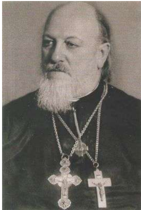
Митрополит Николай (Ярушевич)