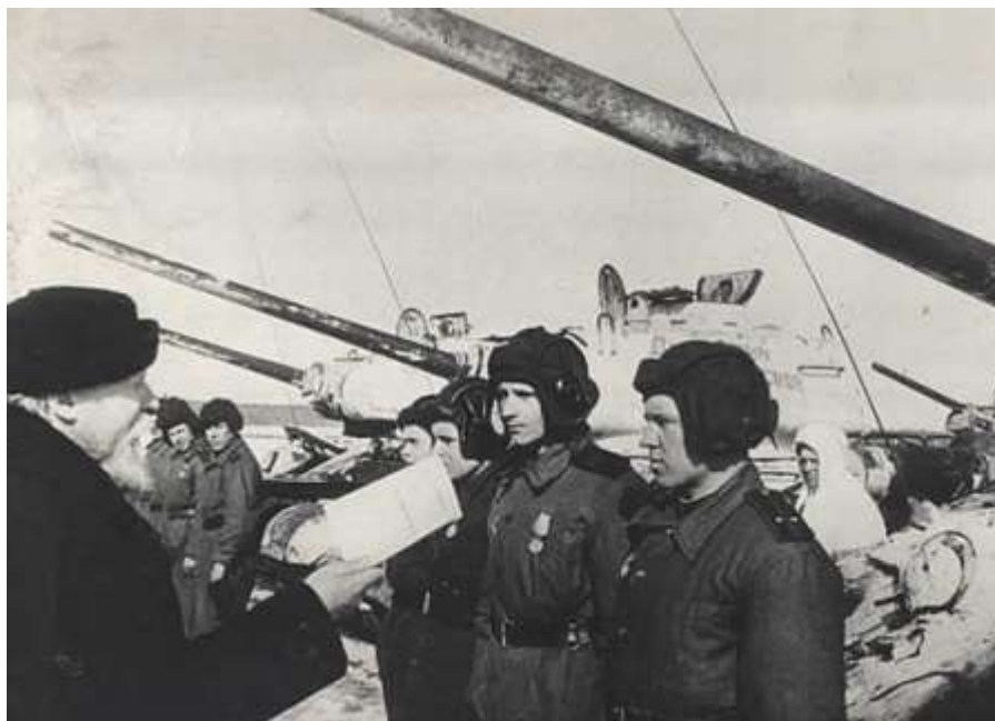
Митрополит Николай (Ярушевич) благословляет бойцов Красной Армии

В реализации возникающих новых возможностей использования религиозного фактора во внешней политике советское государство приоритет, безусловно, отдавало Русской Православной Церкви.