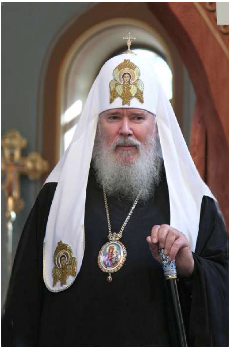
АЛЕКСИЙ II Патриарх Московский и всея Руси

В Послании к 60-летию Победы в Великой Отечественной войне Святейший Патриарх Московский и всея Руси Алексий отметил, что победа нашего народа в годы войны стала возможной потому, что воины и труженики тыла были объединены высокой целью: они защищали весь мир от смертельной угрозы, от антихристианской идеологии нацизма. Отечественная война стала для каждого священной.