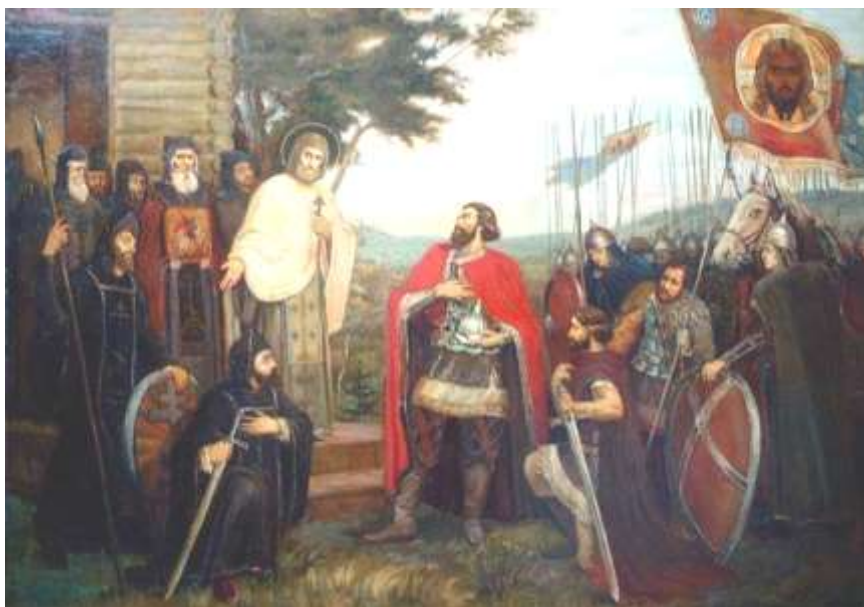
Сергий Радонежский благословляет Дмитрия Донского на ратный подвиг.

На каждом богослужении Русская Православная Церковь молится о властях и воинах страны; ежедневно возносит молитвы об упокоении душ всех, положивших на поле брани свою жизнь.