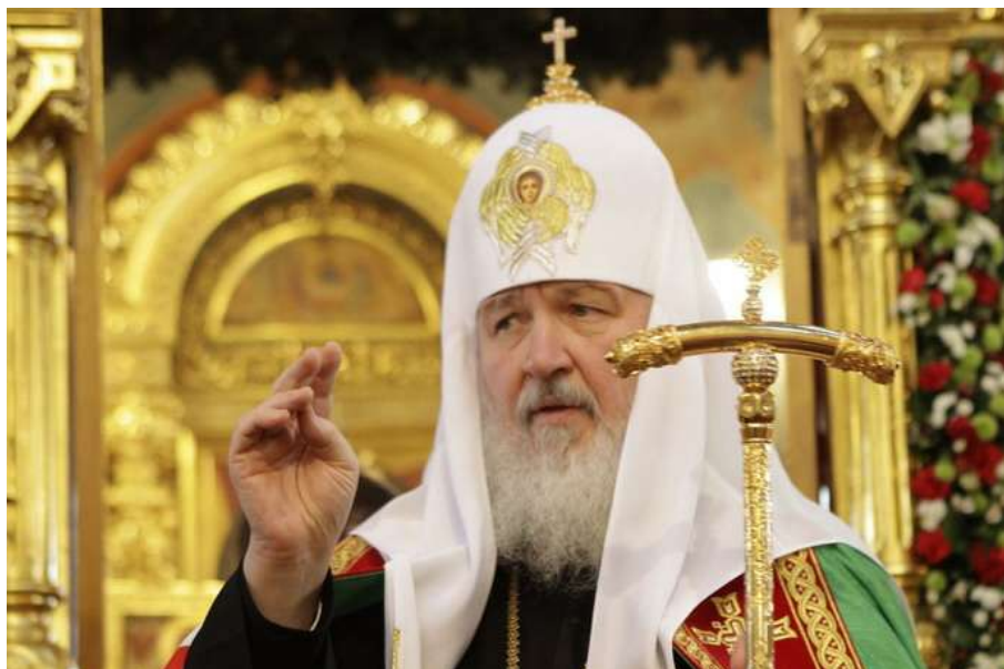
Патриарх Московский и всея Руси Кирилл