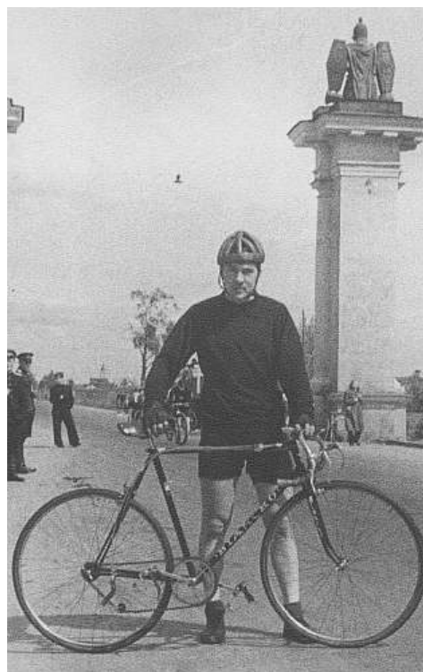
После финиша. Перед стартом Гатчина—Ленинград.

1952, 1953 годы принесли победы на велотреке в соревнованиях на первенстве страны и также на шоссе.