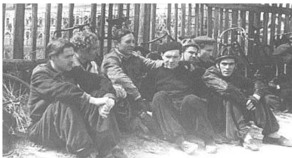
Студенты Института им. Лесгафта. 1950 г.

не стал выяснять причины подобного поведения, так как понял, с кем имею дело.