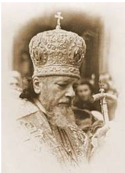
Митрополит Алексей (Симанский).

Лишь 11 июля 1943 года митрополит Алексей впервые за время блокады на короткий срок покинул город и прибыл в Ульяновск, где в то время проживал Патриарший Местоблюститель митрополит Сергей (Страгородский). Многие верующие в Ульяновске запомнили, как владыка Алексей с удивлением говорил: "Боже, как вы все здесь много едите".