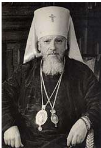
Митрополит Алексей (Симанский)

Когда нацистская Германия и ее союзники вторглись на территорию СССР, Ленинградская епархия одной из первых откликнулась на призыв Патриаршего Местоблюстителя митрополита Сергия всеми силами выступить на защиту Отечества.