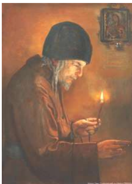
Преподобный Нектарий Оптинский

И вопрос: "Кто же был тем Сергием?" - не остался без ответа. Таким человеком, как стало недавно известно, был последний оптинский старец Нектарий.