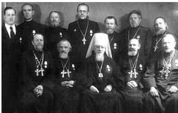
Духовенство Ленинградской епархии, награжденное медалями «За оборону Ленинграда» вместе со своим митрополитом Алексием (Симанским)

Происходили и другие перемены. 14 декабря 1943 года Ленинградскому митрополиту было разрешено иметь технический аппарат, и 15 апреля 1944 года в здании Никольского собора открылась епархиальная канцелярия.