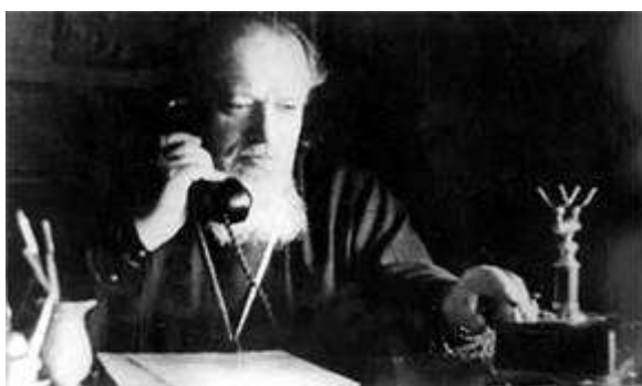
Митрополит Ленинградский и Новгородский Алексий (Симанский). Ленинград, блокада

Ваш агитлисток сыграл немалую роль среди оккупированного населения в деле оказания помощи партизанам, а вместе с этим и борьбе против фашизма. Этот листок среди населения - как Божье письмо, и за него немецкие коменданты в своих приказах грозили смертной казнью, у кого он будет обнаружен. Быть может, Вас уже ставили в известность об этом. Но я, так как его хранил и им агитировал, довожу Вам, что он оказал немалую роль. Его Вам и шлю. Желаю Вам дальнейших успехов в Вашей жизни и плодотворной работе во имя нашей Родины, во имя победы над фашизмом".