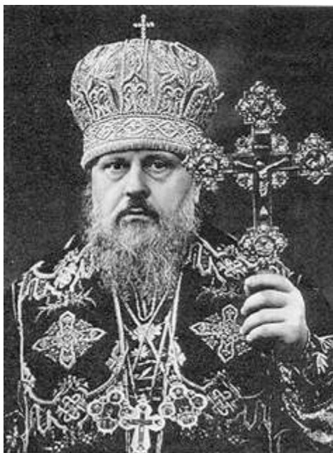
Патриарх Пимен (Извеков) (1971-1990)

На фронтах служили полковые священники. Можно было увидеть батюшку в военной шинели, поверх которой была надета епитрахиль.