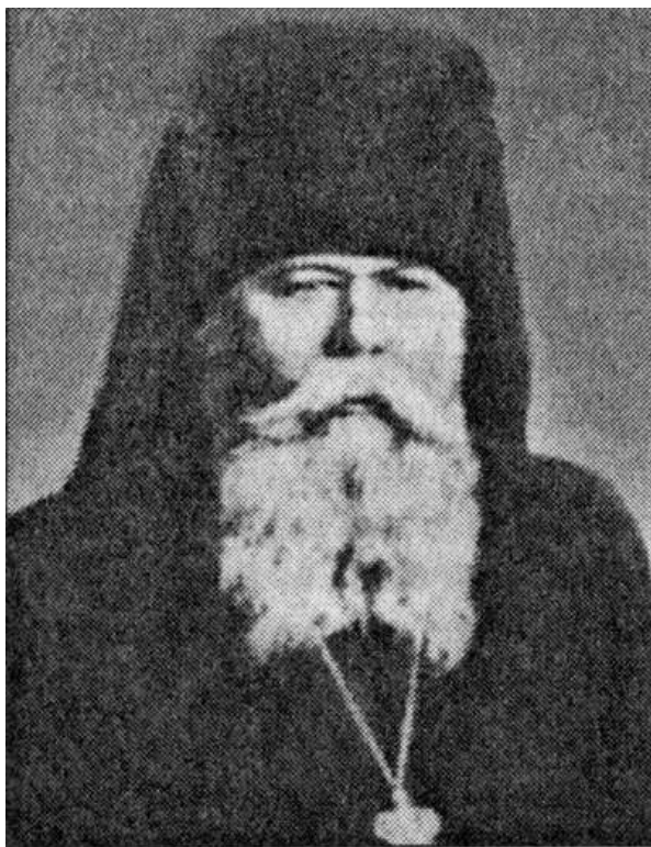
Архиепископ Калининский и Смоленский Василий (Ратмиров). Фото нач. 1940-х гг.

имени Суворова Сергею Чубареву на строительство танковой колонны в фонд обороны 490 рублей.