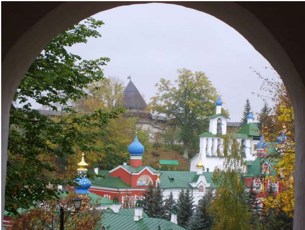
Свято-Успенский Псково-Печерский монастырь

Став наместником Псково-Печерского монастыря, архимандрит Алипий в своих проповедях неоднократно обращался к теме Великой Отечественной. Сохранились записи одной из проповедей отца Алипия.