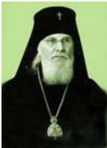
Архиепископ Горьковский и Арзамасский Флавиан

этом деле опыт имел. Цель делегации - убедить фашистов, что в Сварцевичах собраны крупные силы партизан, вооруженных автоматами, пулеметами и орудиями, а дороги вокруг заминированы. Во время разговора с эсэсовским полковником отец Иоанн так сумел убедить его в силе партизан, что офицер приказал своему отряду отступить.