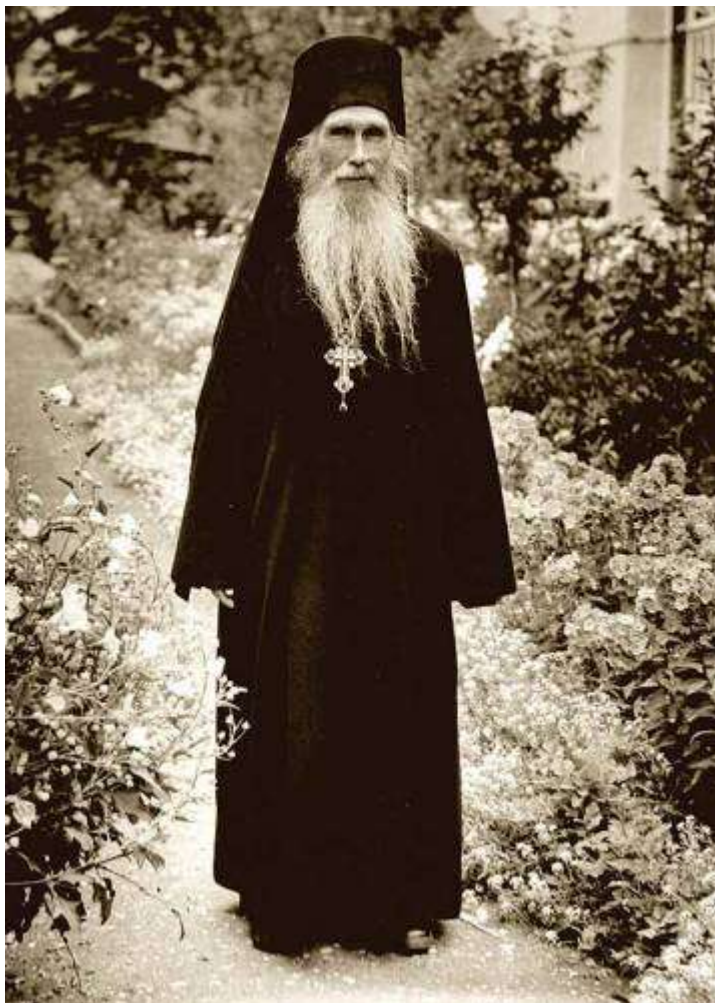
Архимандрит Кирилл (Павлов)

люди любят как своего национального героя и ставят его в один ряд с такими прославленными полководцами, как Суворов и Кутузов".