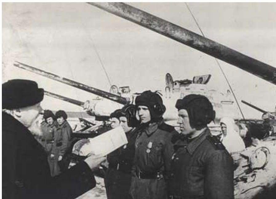
Митрополит Николай (Ярушевич) благословляет бойцов Красной Армии

По-разному сложится военная судьба боевых машин "Димитрия Донского". Короткой и яркой будет она для 38-го полка, продолжительной и скрытной окажется у 516-го. Но 8 марта 1944 года, в день вручения общецерковной колонны, они стояли на одном заснеженном поле.