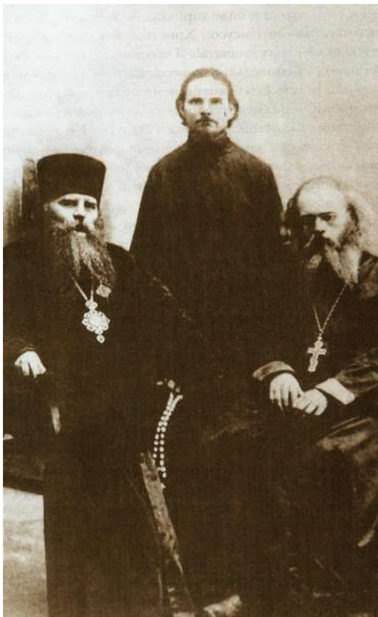
Слева на фото Епископ Ташкентский и Туркестанский Иннокентий (Пустынский), справа священник Валентин Войно-Ясенецкий

В начале двадцатых годов под именем Луки постригся в монахи, был рукоположен в сан епископа. Многократно подвергался арестам и административным ссылкам. Избран почетным членом Московской Духовной академии в Загорске.