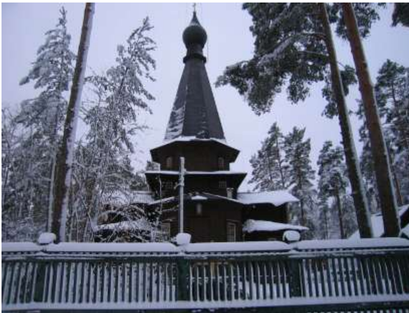
Казанская церковь в Вырице

И еще чудо: немцы, заняв Вырицу, расквартировали в ней часть, состоящую из... православных. Известно, что Румыния была союзницей Германии, но о том, что вырицкая команда будет состоять из румын, исповедовавших Православие, да еще говоривших по-русски,