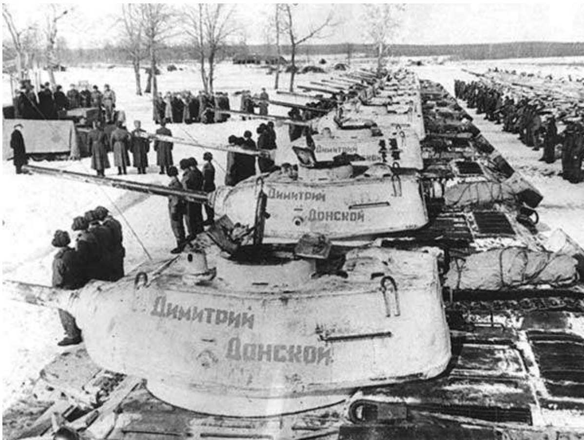
Колонна танков св. Димитрия Донского

На средства, собранные Церковью, была создана воздушная эскадрилья имени Александра Невского.