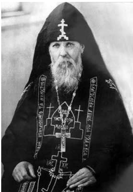
Иеросхимонах Серафим (Муравьев)

Были великие молитвенники о победе над врагом и в России, такие как иеросхимонах Серафим Вырицкий.